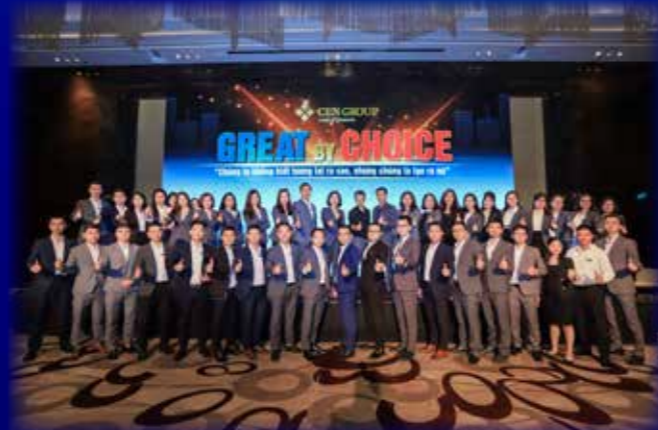
Cen Land được Forbes Asia đánh giá cao qua kết quả kinh doanh tốt, được kỳ vọng có sức bật trong bối cảnh kinh tế khu vực đối diện với nhiều thử thách nhất trong 10 năm qua.

Dù ảnh hưởng bởi dịch COVID-19, doanh thu quý 3 của Cen Land (CRE) vẫn đạt 602 tỷ đồng, tăng 5,8% so với cùng kỳ năm trước, lợi nhuận gộp thu về đạt gần 139 tỷ đồng. Lũy kế 9 tháng đầu năm 2020 doanh thu Cen Land đạt 1.308 tỷ đồng, thực hiện được khoảng 54% kế hoạch cả năm. Lợi nhuận sau thuế đạt hơn 202 tỷ đồng, hoàn thành hơn một nửa chỉ tiêu lợi nhuận được giao cho cả năm.